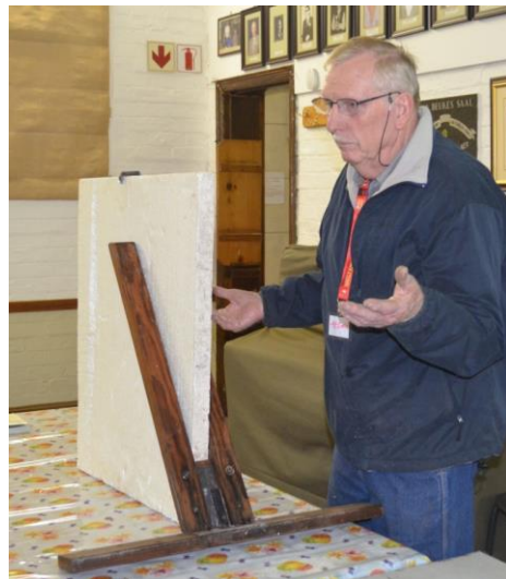
At Smit developed this useful door holder when installing door hardware

The topic for the meeting was "Aids and Gadgets". We had a fair attendance of 32 persons, but a lowish number of entries. These are illustrated in the photographs below.