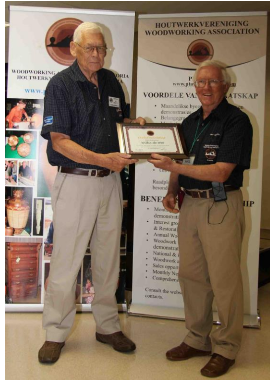
Oorhandiging van sertifikaat van Ereidmaatskap in Januarie 2014 / Handover of Honorary Membership certificate in January 2014.