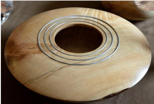
Bak uit Jakaranda deur Johan Labuschagne / Bowl from jacaranda wood by Johann Labuschagne.