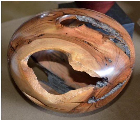
Olienhoutbak van Carel van der Merwe./ Olive wood bowl by Carel van der Merwe.