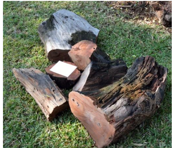
Hout vir die lootjie-trekking / Wood for lucky draws