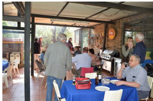
Die saamkuier!./ Relaxation!