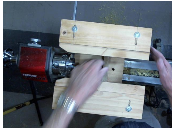
Die gids, wat op die draaibank bed pas, van bo gesien.

'n Tweede metode is om die buitelyne van 'n item op 'n plankie af te teken deur 'n skietlyn vanaf die buitelyne vertikaal te projekteer op die plankie wat daarna as gids gebruik word om die dieptesaag se snylyn te bepaal.