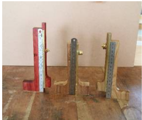
Sommige van die dieptemeters – wat darem klaar gekom het

Ons het hierdie byeenkoms begin deur eerstens te kyk na die dieptemeters wat vir huiswerk gemaak was. Weens verskeie probleme was daar maar min van hierdie projekkies klaar en gevolglik is toe besluit om hierdie huiswerk tot die April vergadering te laat oorstaan.