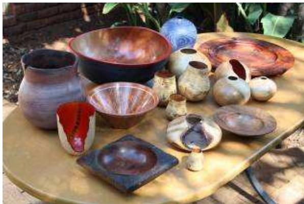
Carel se harpuijsboom-bord het hard gespoek om meer aandag as die bloupot (in die agtergrond) te kry. Links agter staan van Andrew se mooi holvorms en 'n paar van At se "wobble"-potte.