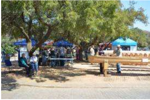
The traders' exhibition area