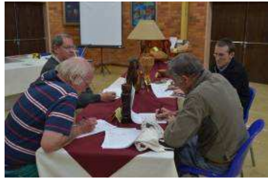
The adjudicators hard at work on Friday evening