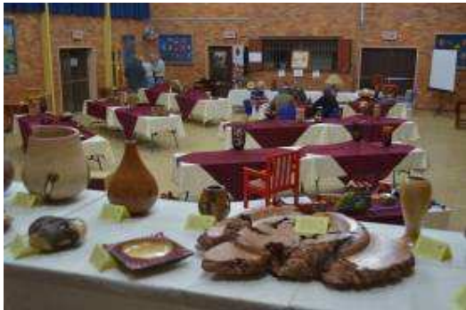
The hall on Friday evening with the adudication still inprogress