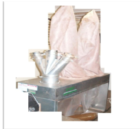
Dust collector CA2C