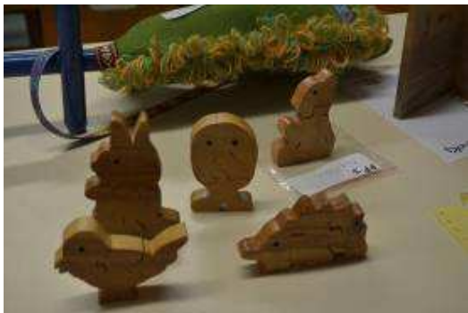
Puzzles by Paul Roberts