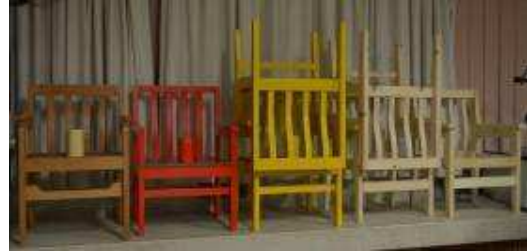
Chairs for the New Hope School – Project