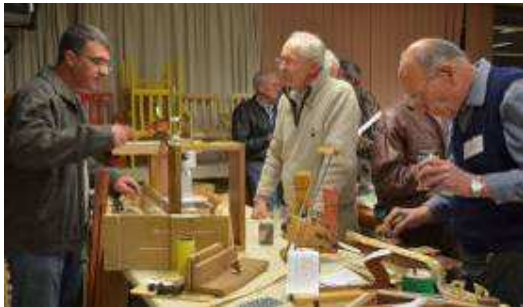
Members having a closer look

For the record we include the following photos: