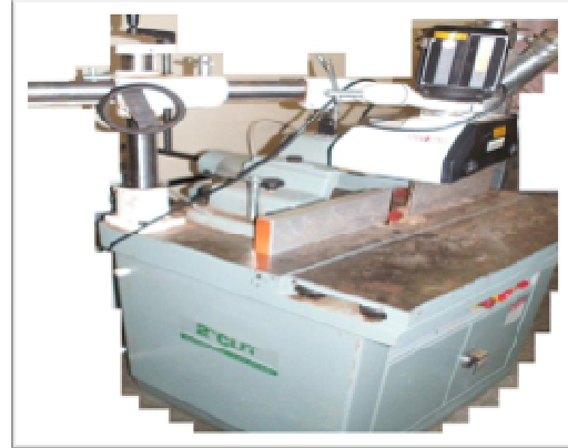
Spindle SS512 +AF FEEDER