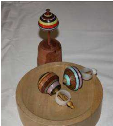
Jack se kleurvolle draaitolle. Die voorste twee lê op 'n holgedraai de blok waarop die tolle kan spin sonder om af te val.