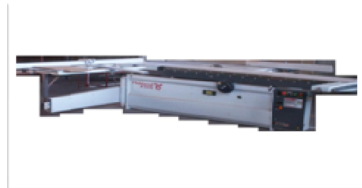
Robland paneelsaag Z320